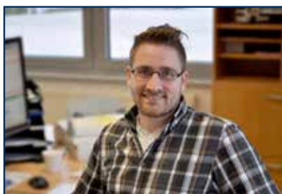
Henning Heuckeroth Disposition

Telefon +49 (0) 4282 50 89 - 17 Telefax +49 (0) 4282 50 89 - 29 E-Mail n.nissen@weigand-transporte.de